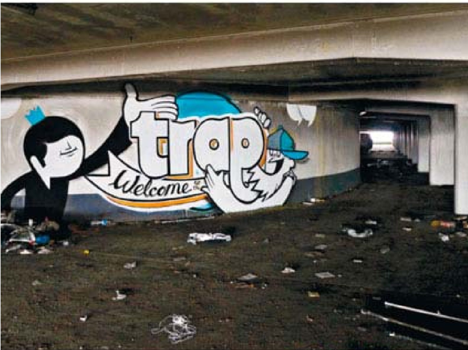
Murals, Muralists et Graffiti des Turbos Design | Photo : Fabien